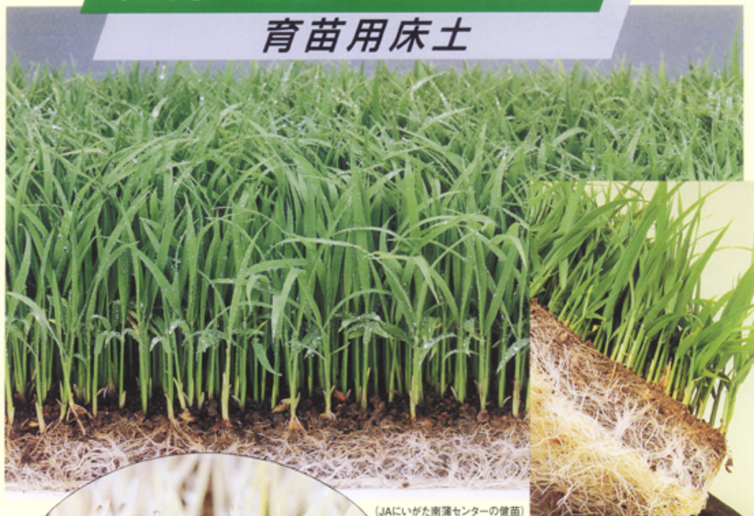
(JAにいがた南蒲センターの健苗)